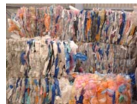
Balles de PEBD couleur

Filmes et housses d'emballages en PEBD couleur ou mélangé à du PEBD naturel