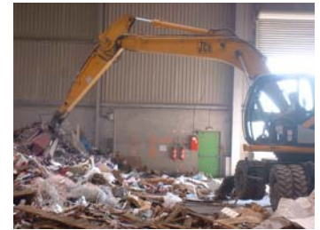
Pré-tri à la pelle