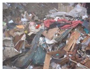
Exemples d'apports de cette catégorie